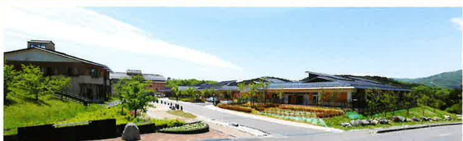
特別養護老人ホーム いいたてホーム (飯舘村)