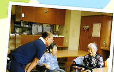
特別養護老人ホーム リリー園 (楡葉町)