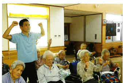
特別養護老人ホーム 花ぶさ苑 (広野町)