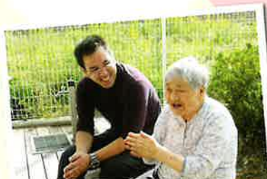
特別養護老人ホーム 梅の香 (南相馬市)